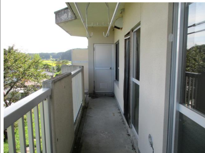
ベランダ（物置付き）