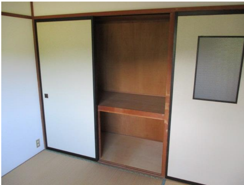
南側和室②（4畳半）押入れ