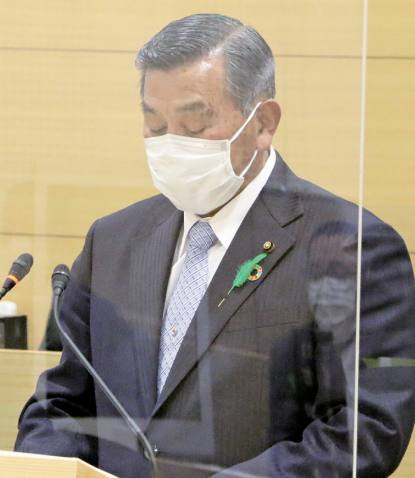
副議長選挙の様子