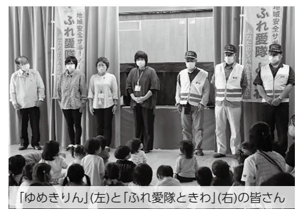
「ゆめきりん」(左)と「ふれ愛隊ときわ」(右)の皆さん