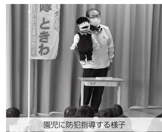
園児に防犯指導する様子