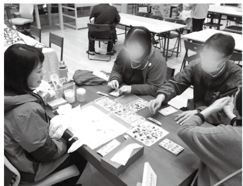
イシモリフェスでのワークショップの一コマ

地域おこし協力隊奮闘記 現在は、田村市への移住を考えている方向けのイベントや体験ツアーの企画運営のほか、市民の方向けの交流会やフェスの企画などを行って