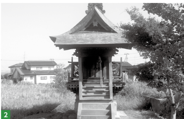
1 坂上田村麻呂像(郡山市所蔵) 2 母・阿口陀姫を祀る谷地神社(郡山市田村町徳定)