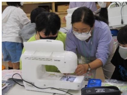
家庭科ミシン学習支援