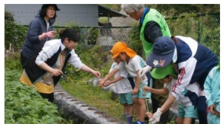
野菜作りのお手伝い