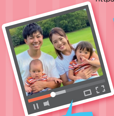
いっちーファミリー

https://www.youtube.com/channel/UCMNoDqzch4-wfQV6hSATmDw