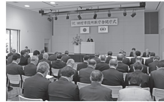
▲新庁舎の多目的ホール（1階）で行われた開庁式