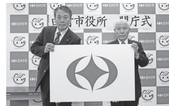
▲市章が降ろされ、旧庁舎の役目を終えました