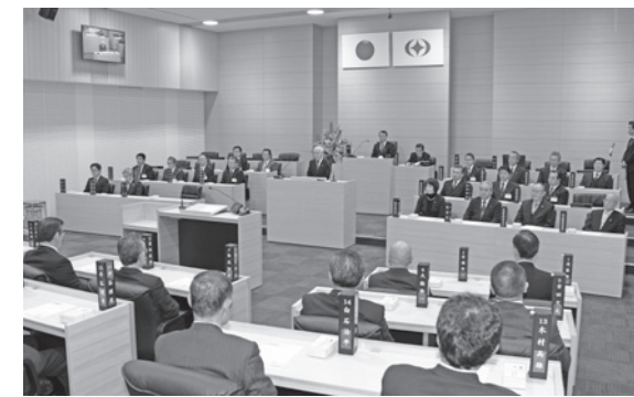
▲新庁舎の市議会議場（4階）で行われた開場式