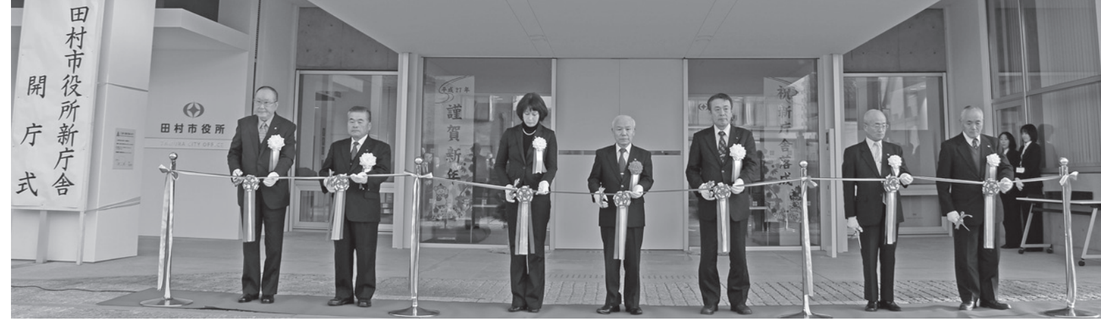
▲1月5日、午前8時に正面玄関前で行われた開庁を祝うテープカット

30分に閉じますので、それ以降にATMをご利用の方は北入口（休日・時間外受付）からお入りください。12月26日には、旧庁舎で閉庁式が行われ、富塚市長と長谷川議長が会議室の市章を降ろし、長年利用した施設に別れと感謝の意を表しました。