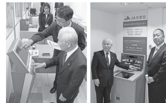
▲登記の請求機を操作する市長 ▲JAのATMが稼働開始