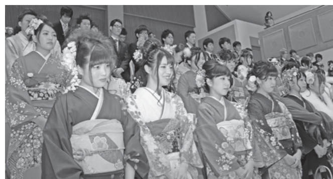
2階席で式に臨む新成人の皆さん