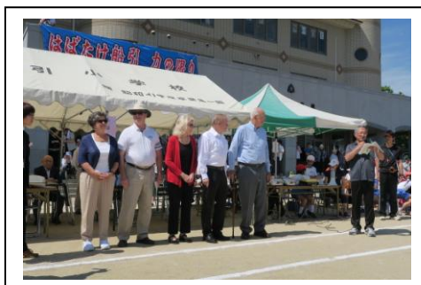
■ 船引小学校運動会見学

平成19年に両市が姉妹都市を締結してから3回目の交流事業。今回の来訪者は毎年10月に行う中学生海外派遣事業の際に、積極的に協力いただいている方々です。