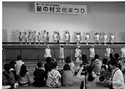
◀星の村文化まつり

星の村文化まつりが10月22・23日の2日間、滝根体育館を中心に開催されました。田村市文化協会滝根支部をはじめ、幼稚園・小中学校や各種団体・企業などの作品展示、ゆるキャラによるキビタン体操、バンド演奏、大道芸、よさこい演舞やかかしコンテストなど多彩な催しが行われました。模擬店では、農業・商工団体などが焼きそばや味おこわなどを販売し、大勢の来場者でにぎわいました。