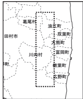
【イメージ図(事業実施想定区域)】