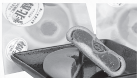
▲山ぶどうの饅頭 …100円(税別)

田村市ご当地グルメプロジェクトが「たむら八彩カレシ」に続き、たむらご当地スイーツ「北醇」を発表しました。「北醇」は田村市滝根町産の山ぶどう(品種名:北醇)を使ったスイーツで、市内の菓子店3店舗が共同開発しました。山ぶどう(北醇)は普通のぶどうよりポリフェノールが多く含まれ、酸味と高い糖度が特徴とのこと。たむらご当地スイーツ「北醇」は、あぶくま洞売店、JA農産物直売所ふあせるたむら、ふねひきパークでも販売しているとのこと。各店舗が趣向を凝らしたスイーツを、ぜひご賞味してみてください!!