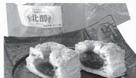
▲山ぶどうのパイ …120円(税別)