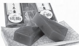
▲山ぶどうの羊羹 …100円(税別)