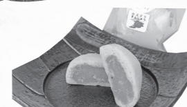
▲山ぶどう饅頭 …80円(税別)