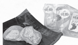
▲冷凍大福 山ぶどう …100円(税別)