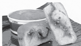
▲ダマンド(アーモンド風味のメレンゲを使った焼き菓子) …139円(税別)