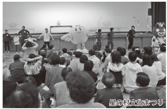
星の村文化まつり

10月28・29日には「地域文化を育て、愛と夢のある文化祭にしよう」をテーマに、各種作品等展示会が船引小学校体育館などで開かれました。そのほか、語り部による昔ばなし会、お茶会、木工教室など、多彩な催しが行われました。また、文化センターの外では「わくわくフリーマーケット」「軽トラ市」などが行われ、来場者は楽しく交流しました。