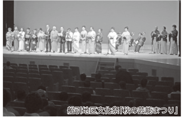
船引地区文化祭「秋の芸能まつり」

【船引地区文化祭】 10月1日、「秋の芸能まつり」が市文化センターで行われ、船引町民謡民舞の会加盟団体などが踊りや歌、楽器演奏などを披露しました。