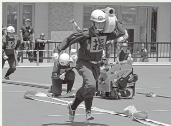
▲小型ポンプ操法の部で優勝した船引地区隊