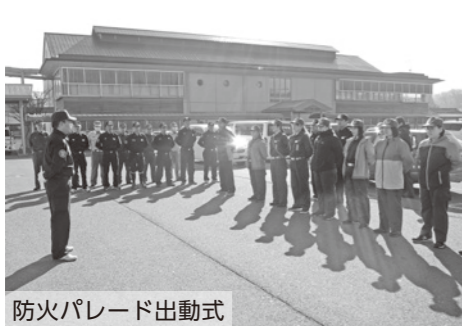
防火パレード出動式