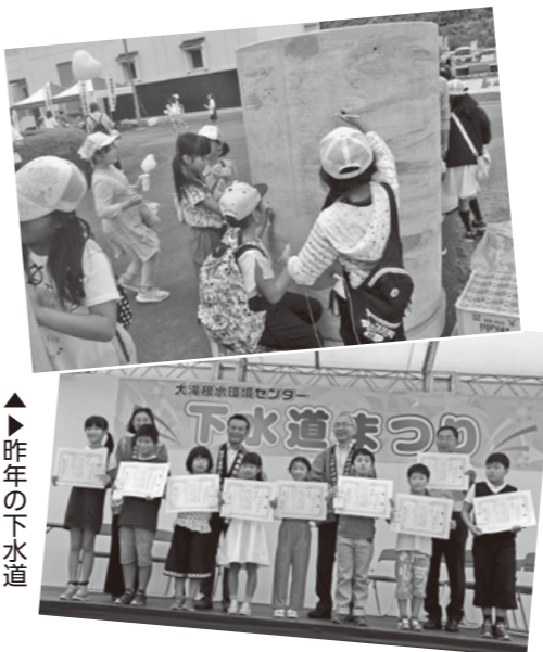
▲▲昨年の下水道まつりの様子

ポスターコンクール表彰式、下水道&マンホールクイズ、マンホール落書きコーナー、バランスカート乗車体験、郡山高枝チアダンス部によるチアダンスショー、マジカルバルーンYesショーなど