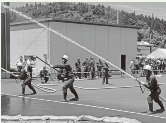
▲ポンプ車操法の部で優勝した船引地区隊

アベック優勝した船引地区隊は、7月22日、田村消防署で開かれた第7回 福島県消防協会田村支部消防操法大会に、田村市消防団の代表として出場しました。