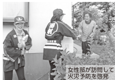
女性部が訪問して火災予防を啓発