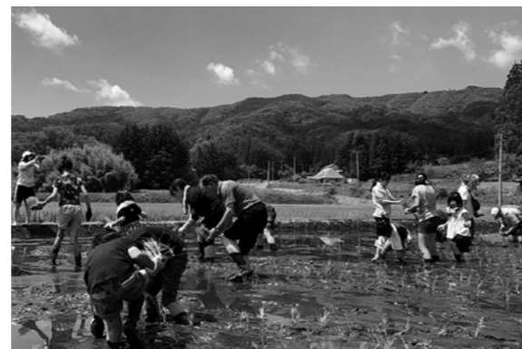
▲田植え体験のようす(大越町牧野)

県内在住の小学生ら19名が参加し、田植えやサツマイモの定植、春野菜の収穫体験が行われました。参加した小学生は全員初めての田植え体験で、素足で田んぼに入り、泥んこになりながらも楽しむ姿が印象的でした。お昼は地元のお母さん方による料理が振る舞われ、交流を深めました。