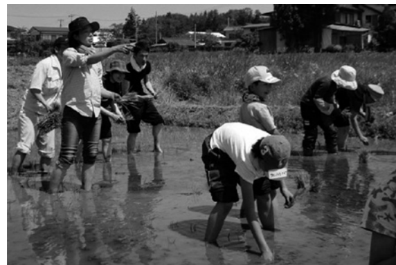
▲田植え体験のようす(船引町堀越)

市外から19名の親子らが参加し、夏晴れのなか苗の手植え体験やサツマイモの定植体験、竹筒の水鉄砲づくりなど田舎ならではの体験が行われました。お昼には、三五八を使用した創作郷土料理が振る舞われ、参加者から好評の声が上がりました。10月には稲刈り体験会が行われる予定です。