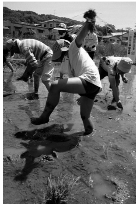
▲田んぼに足をとられます(船引町堀越)