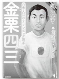
文/佐野慎輔 絵/しちみ楼