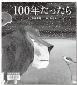
文/石井睦美 絵/あべ弘士