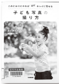
著/椎名トモミ 監修/藪田織也