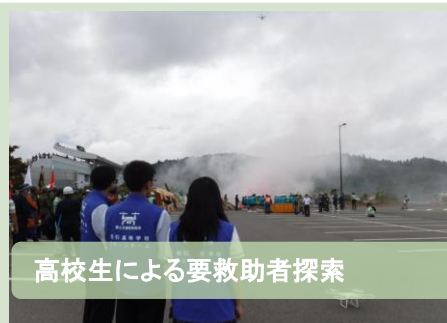
高校生による要救助者探索