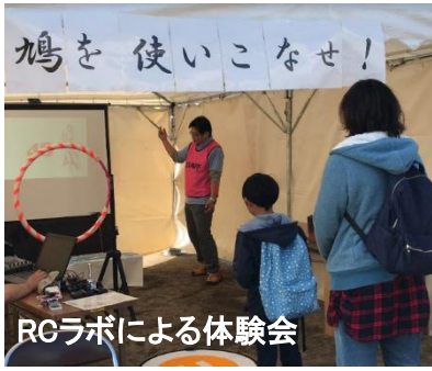
RGラボによる体験会