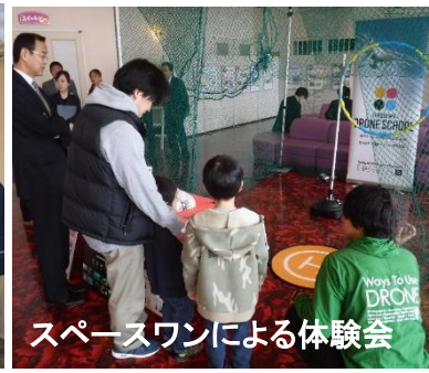
スペースワンによる体験会