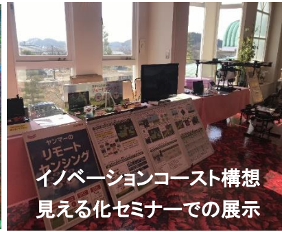
イノベーションコースト構想 見える化セミナーでの展示