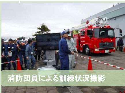
消防団員による訓練状況撮影