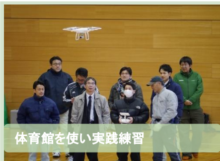
体育館を使い実践練習