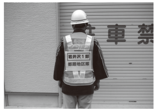
▶指揮者のベストは、災害時に消防署と連携をとりやすくします

都路地区隊の取り組みを紹介します。 まず、住民の安全安心のために、月に3回（5日、15日、25日）の夜警と車両・機具などの点検をしています。 また、夜間の火災に備え、水利の場所がわかりやすくなるように、反射材を貼った巣箱を設置しています。 火災を早い段階で消火するためには、分署との連携が重要です。火災現場では、各部の指揮者が「ベスト」を着用し分署員との連携をとりやすくしています。 今後も都路地区隊は「火災ゼロ」を目標に活動していきます。