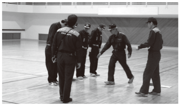
▶新入団員は規律訓練から始めます