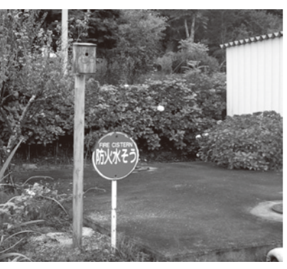
▶反射材を貼った巣箱で水利の場所をわかりやすく

都路地区隊の取り組みを紹介します。 まず、住民の安全安心のために、月に3回（5日、15日、25日）の夜警と車両・機具などの点検をしています。 また、夜間の火災に備え、水利の場所がわかりやすくなるように、反射材を貼った巣箱を設置しています。 火災を早い段階で消火するためには、分署との連携が重要です。火災現場では、各部の指揮者が「ベスト」を着用し分署員との連携をとりやすくしています。 今後も都路地区隊は「火災ゼロ」を目標に活動していきます。