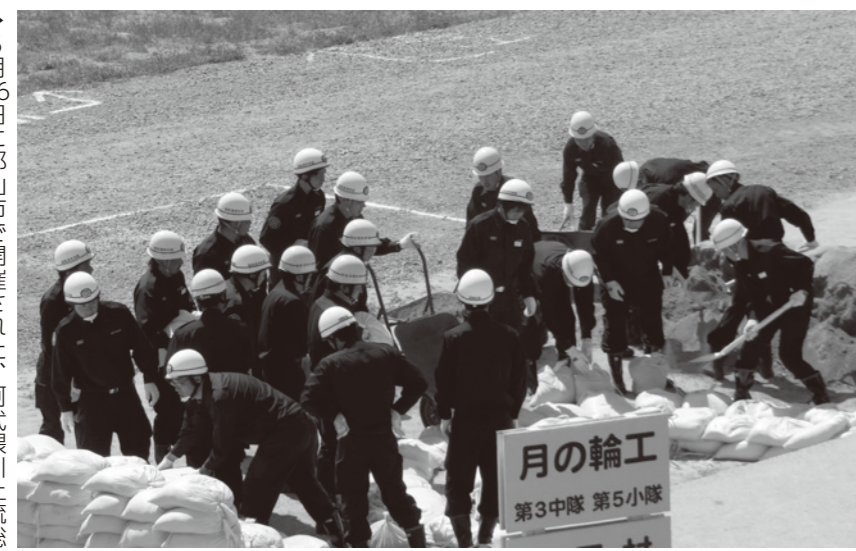
▶5月26日に郡山市で開催された、阿武隈川上流総合水防演習。訓練分団長を筆頭に4名の団員が訓練に参加しました。

今回の消防団だよりは、都路地区隊を紹介しています。今年4月から、組織図に示した新体制で活動しています。