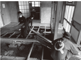
▲経費を抑えるために、まずは自分たちで解体。体鍛えといてよかった…。

りしています。そこで、一緒にこの空き家改修やDIY、企画を手伝ってくれる方を募集しています！現状は、家の破壊（壁や天井）を少しずつ進めている状況ですが、ゆくゆくは縁側やウッドデッキをDIYしたり、そこで行われる企画を考えたり〜なんてことを、進めていきたいと考えています。実は、すでに5人ほど協力してくれている仲間もいます。みんながワイワイ協力しながら、自分たちと一緒に空き家の破壊と再生をしてみませんか？ 興味のある方は、Facebookの「田村空き家の窓口」と検索または、テラス石森「0247-617575」まで、ご連絡ください！