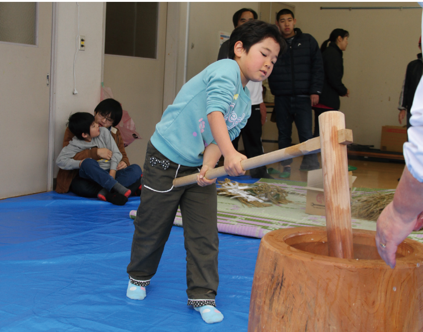
ひとりできるもん！参加児童が一人ずつ餅つき体験（12月7日撮影「正月飾り作り・もちつき」12ページに関連記事）