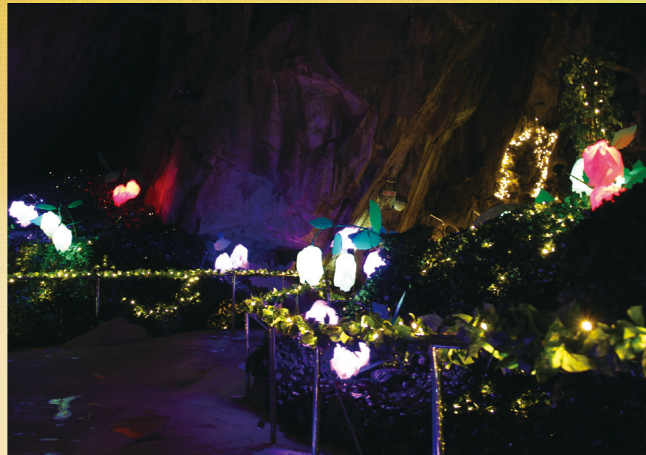
▲あぶくま洞内「星窟」点灯:3月1日まで（営業時間の8:30～16:30まで 入洞料が必要です）