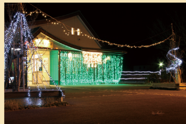
▲JR磐城常葉駅 点灯:1月12日まで(16:00～翌4:00)