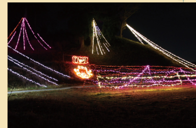
▲大越町牧野地区 点灯:1月12日まで(17:00～23:00)