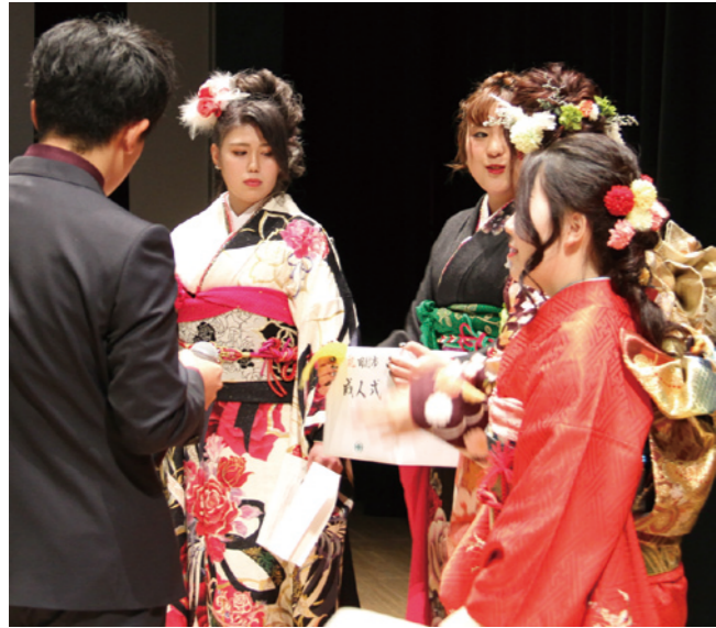
抽選会を前に打ち合わせをする実行委員会のみなさん