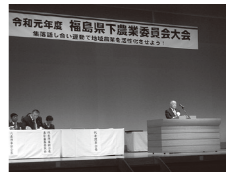
代表理事会長挨拶