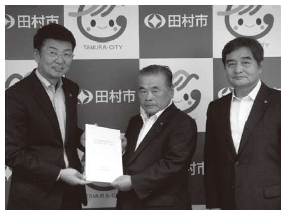
昨年10月11日、村上会長（中央）と吉田会長職務代理者（右側）が本田市市長に意見書を提出しました。