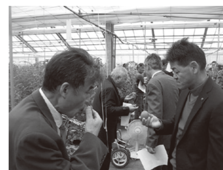
周年栽培のトマトを試食する各委員