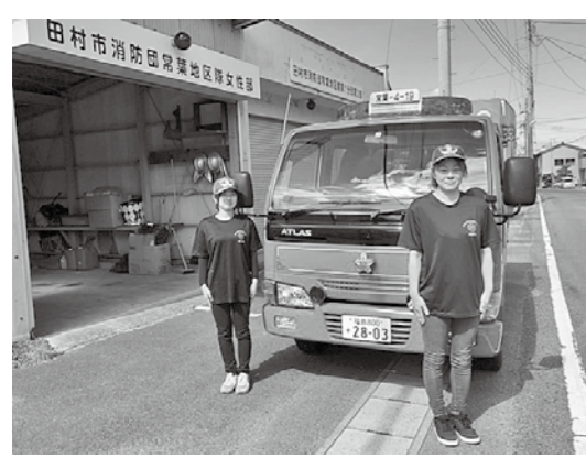
▲火災予防広報活動出発前の女性団員