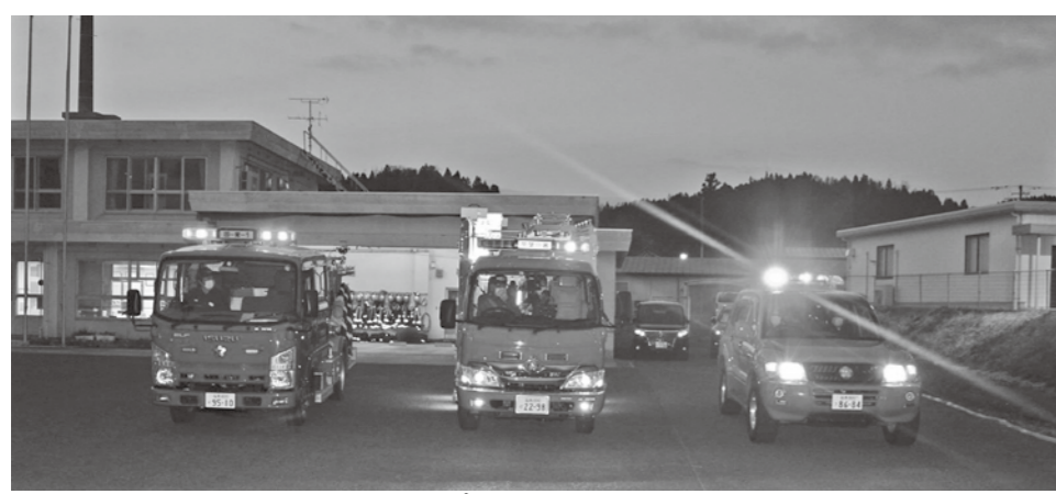
▲4月17日に「常葉町大火防パレード」を行いました。

常葉町は5月14日に火災ゼロ2年を達成しました。これは地域住民の皆さんが火災予防を心掛けていただいた成果です。火の取り扱いに十分に注意し、火災のない町づくりにご支援とご協力をお願いします。