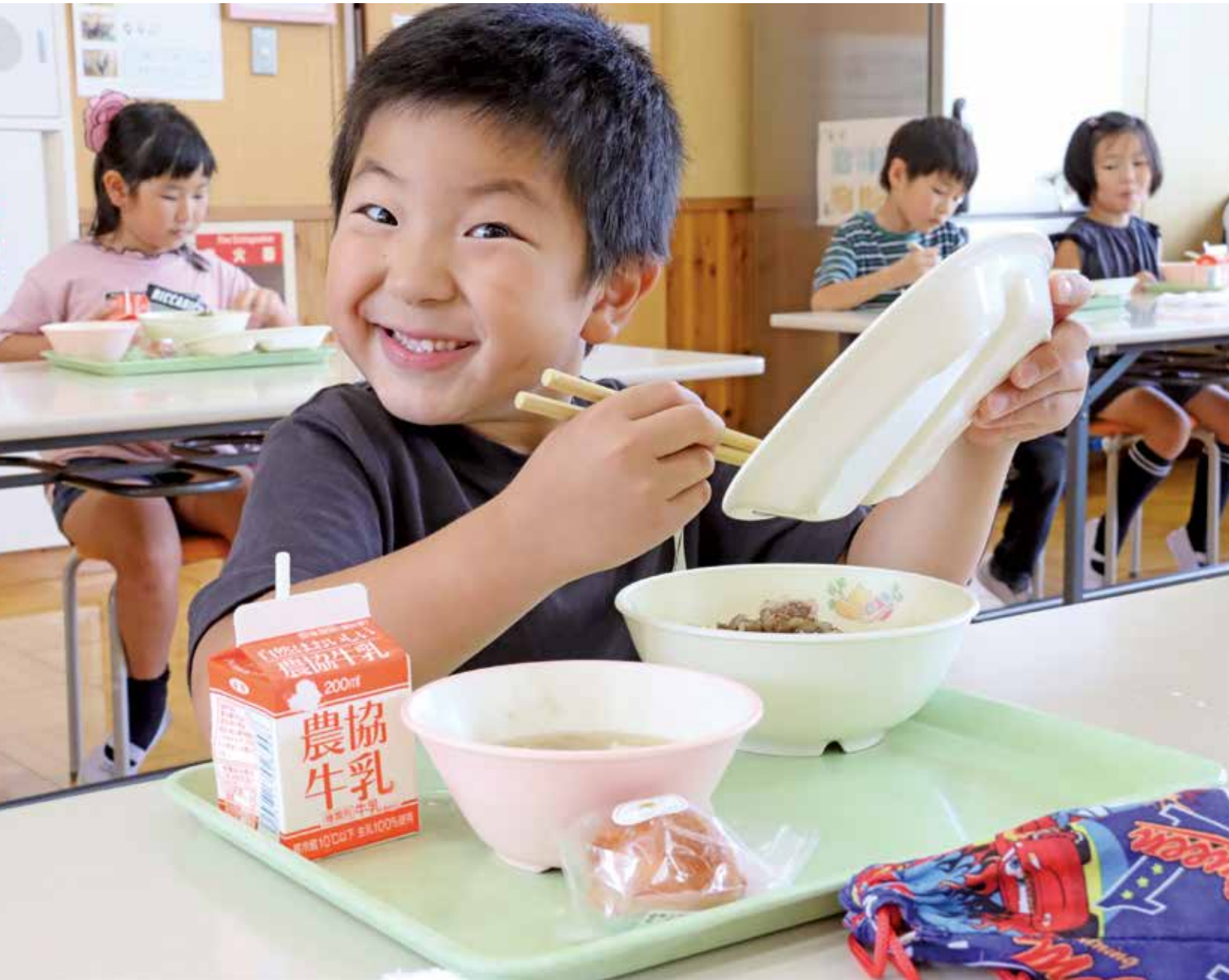
給食、だ～いすきっ！（「市産食材の日」8月25日 美山小学校）