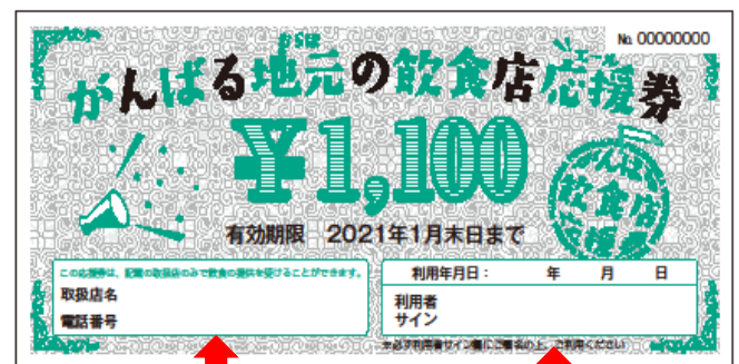
【法人事業者用利用券額面 1,100 円】