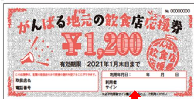
【利用者サインがあるもの】