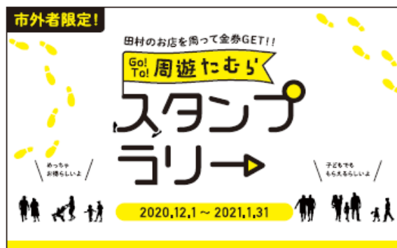
↑ スタンプ台紙イメージ

市内店舗の周知と周遊促進、事業者支援を目的として「周遊たむらスタンプラリー」を実施します。