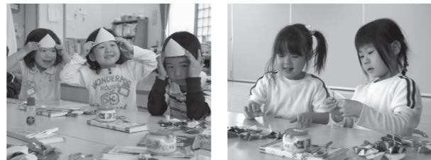
▲折り紙で「かたつむり」や「あじさい」をつくったよ。

幼い頃、誰もが描いた「将来の夢」。震災から3カ月。当たり前だった日常が、当たり前でなくなりました。それでも、田村の子どもたちは未来に向かって、一歩ずつ、しっかりと歩んでいます。変わることはない子どもたちの笑顔は、私たちに希望を与えてくれます。小さなからだで思い描く、大きな夢。仲間を大切に心を続けながら、まっすぐ前を見て成長してほしい。