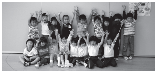
▲おともだちと毎日元気いっぱい遊んでるよ。