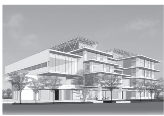
平成24年12月ごろから本庁舎建設工事に着手し、平成26年12月の完成を目指します。