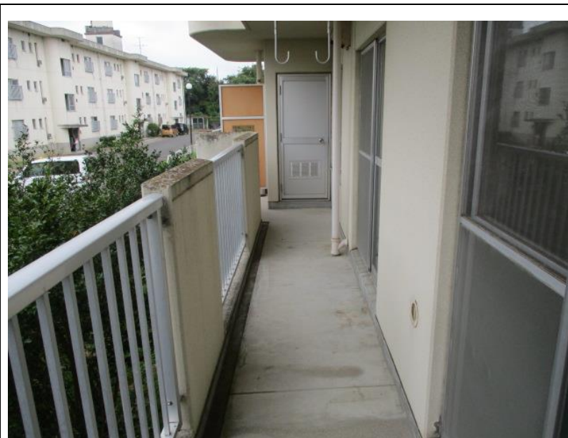
ベランダ（物置付き）