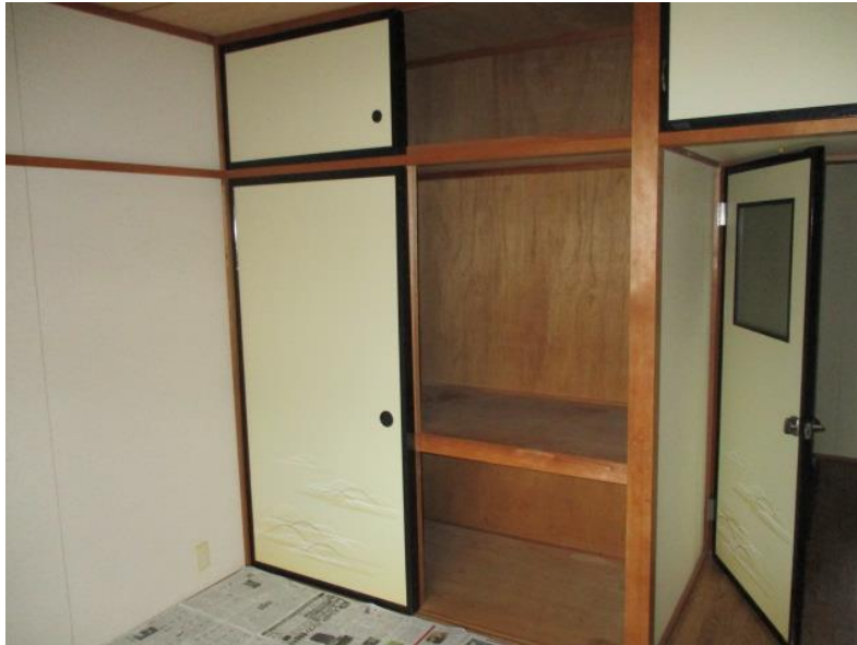
南側和室②（4畳半）押入れ