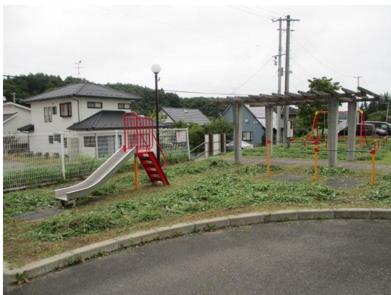
遊具（すべり台、鉄棒）