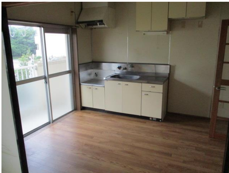
台所（ダイニングキッチン）

※通常、給湯設備・ガスコンロはありませんがLPガス取扱業者にて設置可能です（費用は自己負担）。