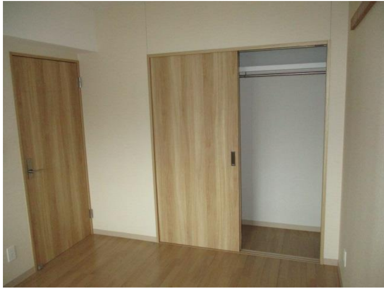
北側洋室②（クローゼット）