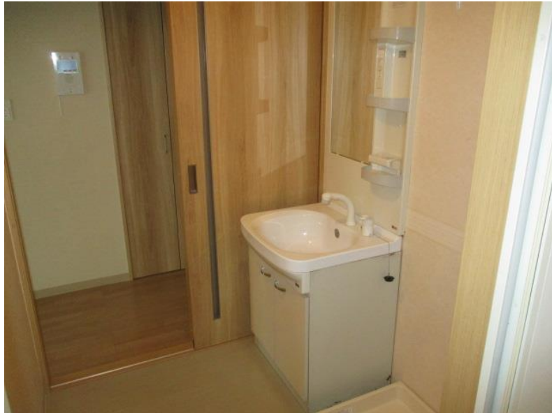
洗面台・洗濯機置き場・脱衣所