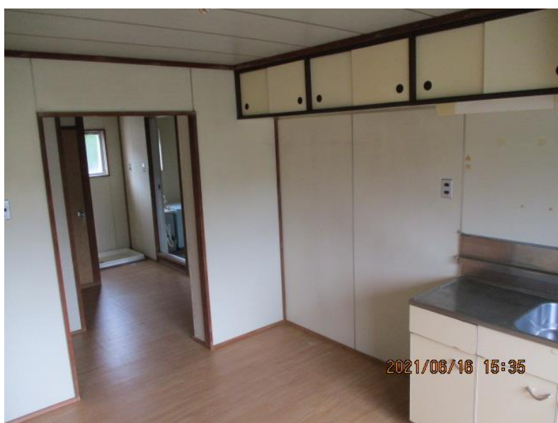
台所（ダイニングキッチン）