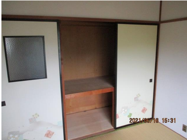
南側和室②（4畳半）押入れ