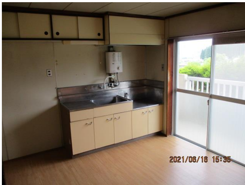
台所（ダイニングキッチン）

※通常、給湯設備・ガスコンロはありませんがLPガス取扱業者にて設置可能です（費用は自己負担）。