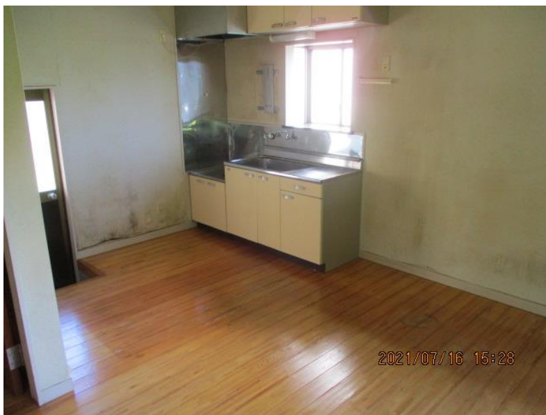
台所（ダイニングキッチン）

※通常、給湯設備・ガスコンロはありませんがLPガス取扱業者にて設置可能です（費用は自己負担）。