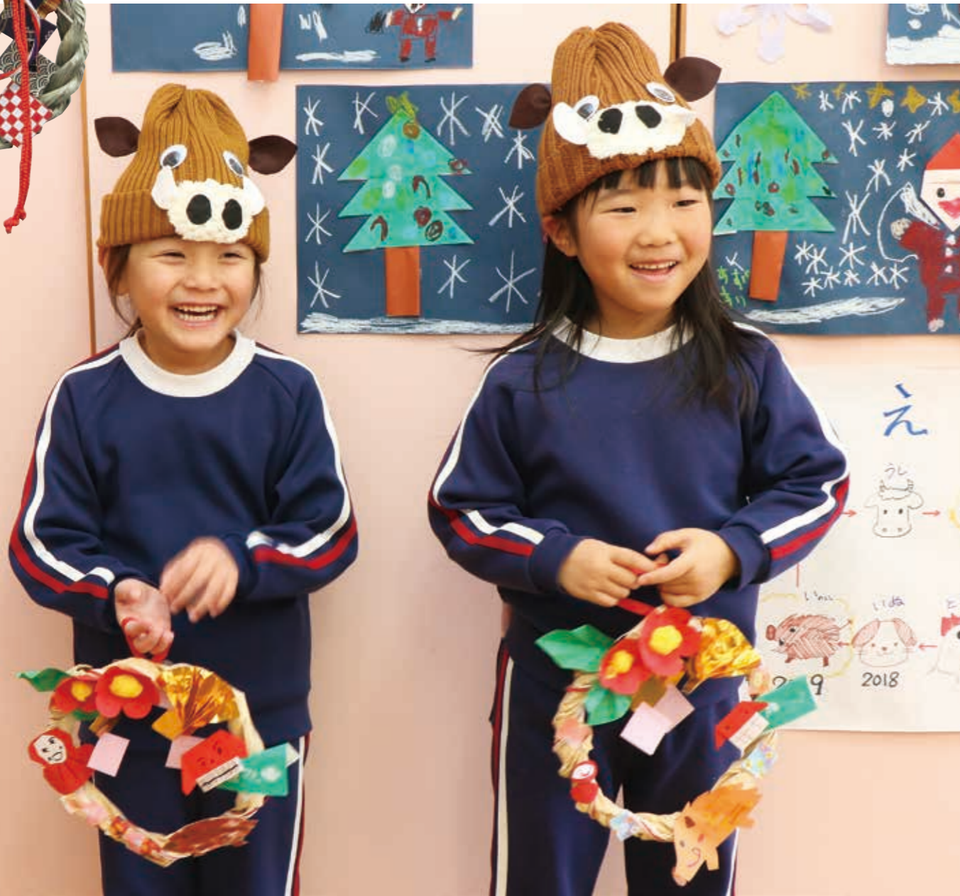
お正月用の飾りをつくったよ！（平成30年12月19日 都路こども園）