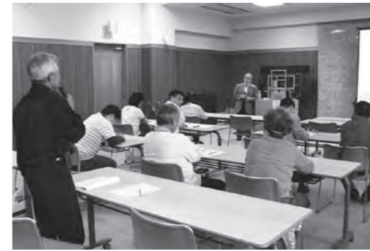
6/17 大越地区の放射線講演会