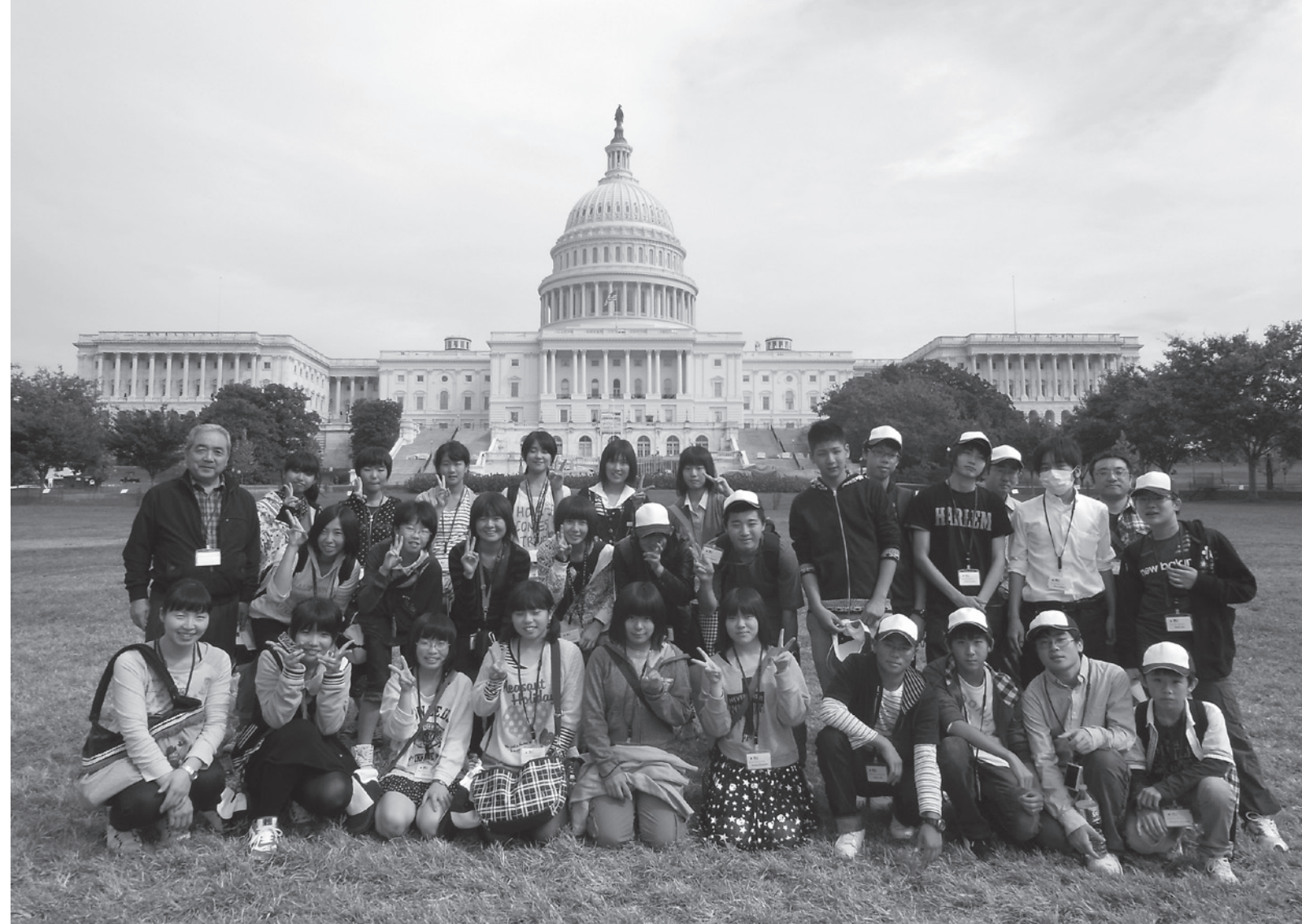
▲アメリカ合衆国議会議事堂前での集合写真

未来を担う本市の中学生を対象に、本年度は2コースの研修事業を実施しました。異文化や外国人との交流をとおりて研修生が見て、話して、感じとったことなど、貴重な体験をまとめた報告の中から一部を抜粋して紹介します。