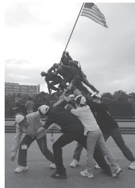
海兵隊戦争記念碑前