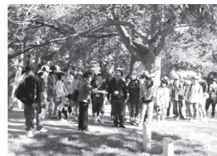
アーリントン国立墓地