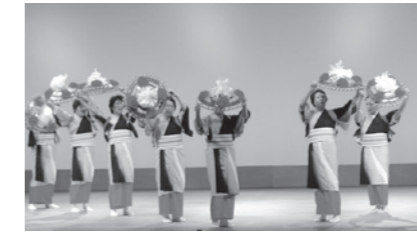
平成24年度 ふねひき春のうたまつり

福祉 船引総合福祉センター ☒funehiki-sofuku@city.tamura.lg.jp ☎82-0600 ☎82-0600