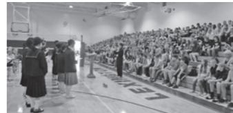
レキシントン・ジュニアハイスクール (写真上下・左右)

私たちのことを引き受けてくださったホストファミリーに対して、感謝の気持ちを忘れてはいけないと思いました。